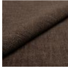
Nowa 33L4 Nutmeg 1024303