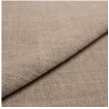
Nowa 84B2 Sand 1024301