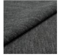
Nowa G2G1 Stone 1024312