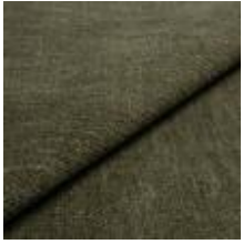
Nowa 60Z3 Garden 1024307