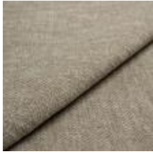
Nowa B2A9 Beige 1024302