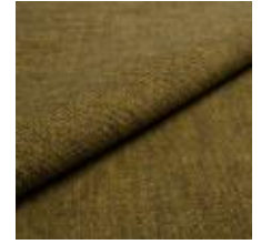
Nowa BNAC Lemongrass 1024306