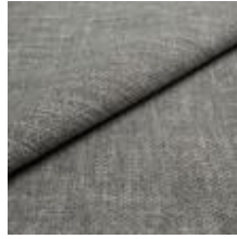
Nowa 84A6-1 Concrete 1024309