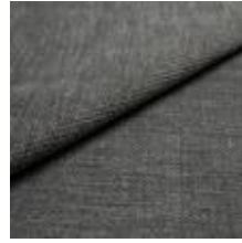
Nowa U5D8 Dolphin 1024310