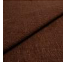
Nowa FU89 Brick 1024305