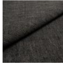
Nowa G2J3 Brown 1024304