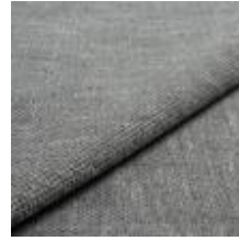
Nowa 84U3 Alu 1024311