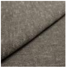
Nowa 79R1 Taupe 1024313