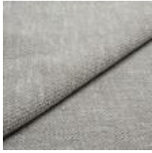
Nowa 84Q3-1 Soft silver 1024308